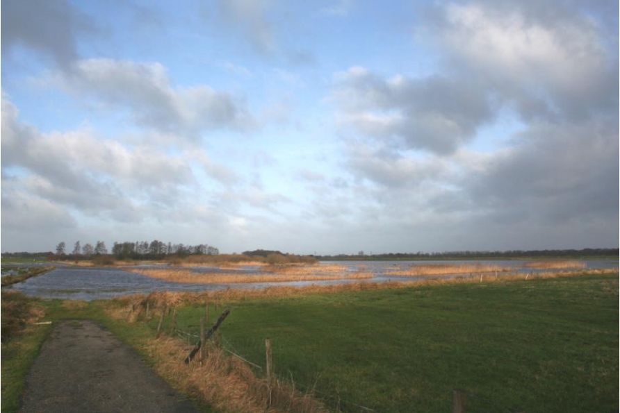
Turfweg, ten noorden van Marum

Tot het begin van de vorige eeuw was de turfwinning de belangrijkste bron van inkomsten in het dorp. In 1812 bestond het dorp uit 12 veenboerderijen waarin 17 gezinnen van de turfwinning leefden. Daarna heeft de agrarische sector en met name de rundveehouderij, zich verder ontwikkeld.