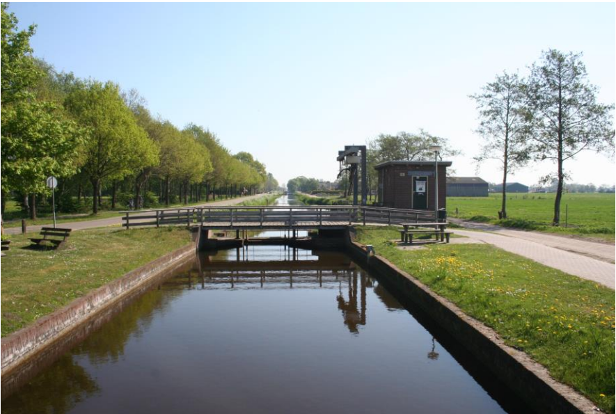
Sluis in de Jonkersvaart