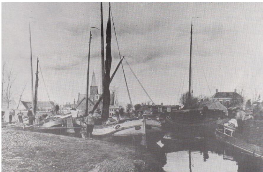
De oude haven van Marum