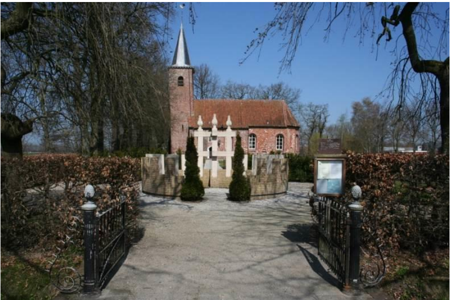
Romaanse kerk Marum, met op de voorgrond het oorlogsmonument

De naam Marum komt van 'Mare', water, en 'heim', plaats, en betekent dus 'plaats aan het water', waarin het water het Oude diep is. Oorspronkelijk is het een lintdorp. De lintbebouwing liep van 't Malijk, langs de Kruisweg en de Hoornweg tot De Haar, op een hoger gelegen zandrug. Aan de rand van het dorp aan de Noorderringweg in Marum-West staat een monumentale romaanse kerk. Het oudste deel, het koor, dateert uit de tweede helft van de 12 e eeuw en is daarmee een van de oudste bakstenen bouwwerken in Groningen. Het schip en de toren van de kerk werden in de 13 e eeuw gebouwd. In het midden van de zestiende eeuw werd de toren verhoogd met een klokkenzolder en werd op het schip de huidige kap aangebracht.