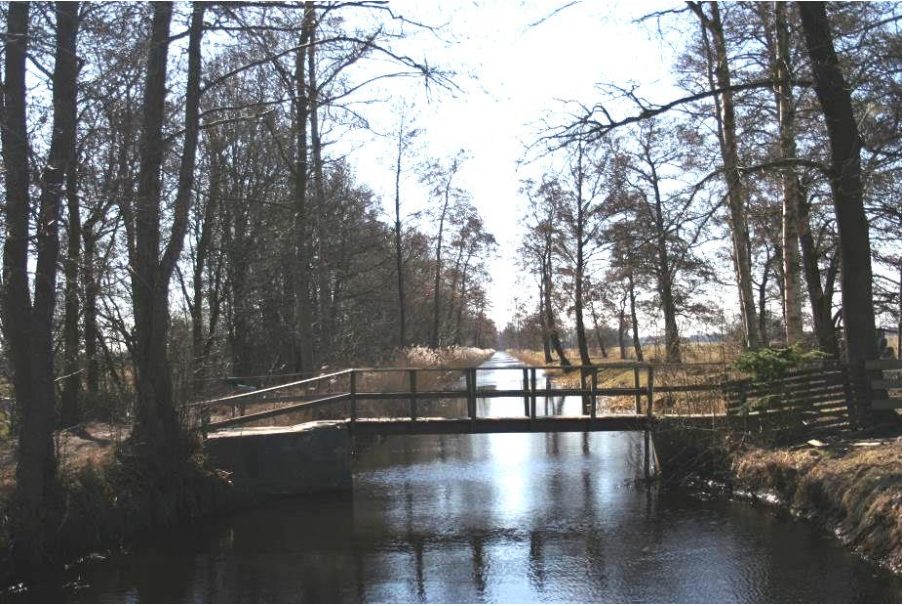
Bruggetje bij Pierswijk

De Pierswijk is genoemd naar Pier Holtrop. De familie Holtrop woonde op het Frimasteenhuis, een steenhuis dat aan de westzijde van de Pierswijk aan het Malijkse Pad moet hebben gestaan en allang is verdwenen. De Pierswijk is gegraven tussen 1836 en 1852. Aanvankelijk was de wijk bestemd voor de afvoer van turf, maar werd daarna gebruikt voor de aanvoer van melk met pramen naar de zuivelfabriek die op de plaats stond waar later de timmerfabriek is gekomen. Ook voor deze fabriek werden de materialen via de Pierswijk aangevoerd. De Pierswijk is in gebruik geweest tot halverwege de vorige eeuw, toen de opkomst van de vrachtauto de kleine binnenscheepvaart overbodig maakte.