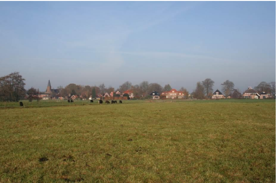
Zicht op Marum vanaf de zuidzijde